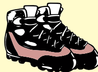
履き慣れた運動靴